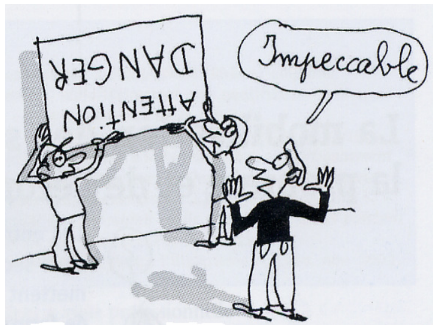
Dessin de Jacques Azam pour les éditions Milan « L'illettrisme, mieux comprendre pour mieux agir »